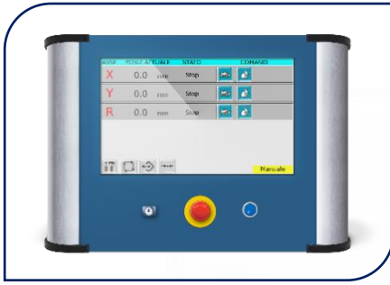
POSITRONIC 1 asse